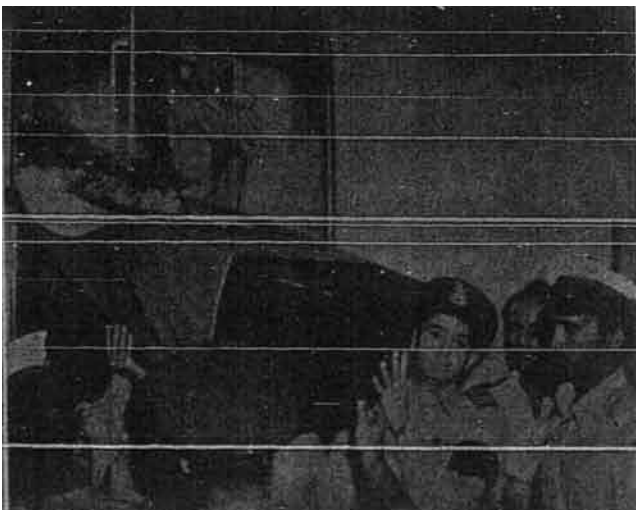
Jenazah almarhum itu telah dibawa dari Rawalpindi ke Karachi dengan kapal terbang pada subuh-subuh 17 Oktober.