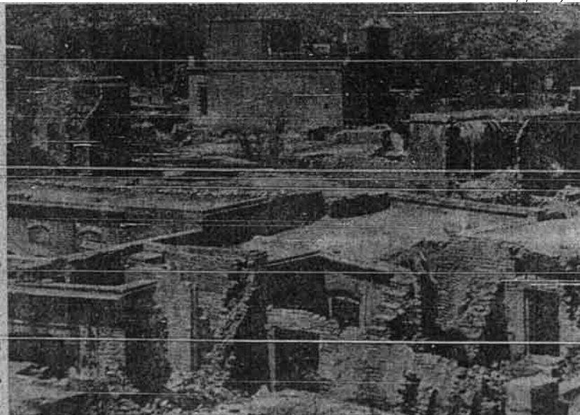
Pemandangan dalam sebuah kawasan di daerah Azad Kashmir

Orang-orang Islam adalah dibeza-bezakan dalam segala urusan kehidupan. Mereka tidak ada suara dalam pertadbiran negeri. Mereka tidak ada kemudahan-kemudahan kerana mendapat pelajaran. Menurut penyata banci tahun 1941, hanya empat orang daripada tiap-tiap seratus orang yang berpelajaran, manakala angka orang-orang Hindu dan Sikh yang berpelajaran 15 peratus dan 32 peratus tiap-tiap satu bahagian.