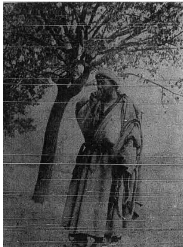
Daripada gambar ini nampak dengan terangan menunjukkan keadaan dan penderitaan orang-orang Islam di Kashmir.

Juga kerajaan negeri itu berfikir bahawa pembalasan