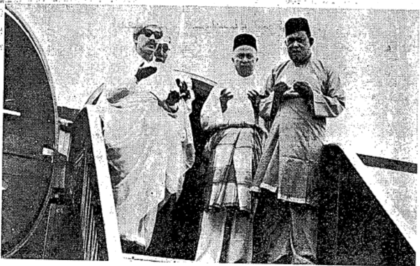
Duli Yang Maha Mulia Sultan Brunei (kiri) tatkala tiba di Brunei dari menunaikan fardu haji yang kedua, bersama-sama dengan Dato' Setia Mursal (Menteri Besar Brunei) di tengah-tengah dan Duli Pangiran Pemanca.