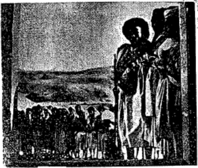
Inilah jenisnya tentera-tentera Yaman