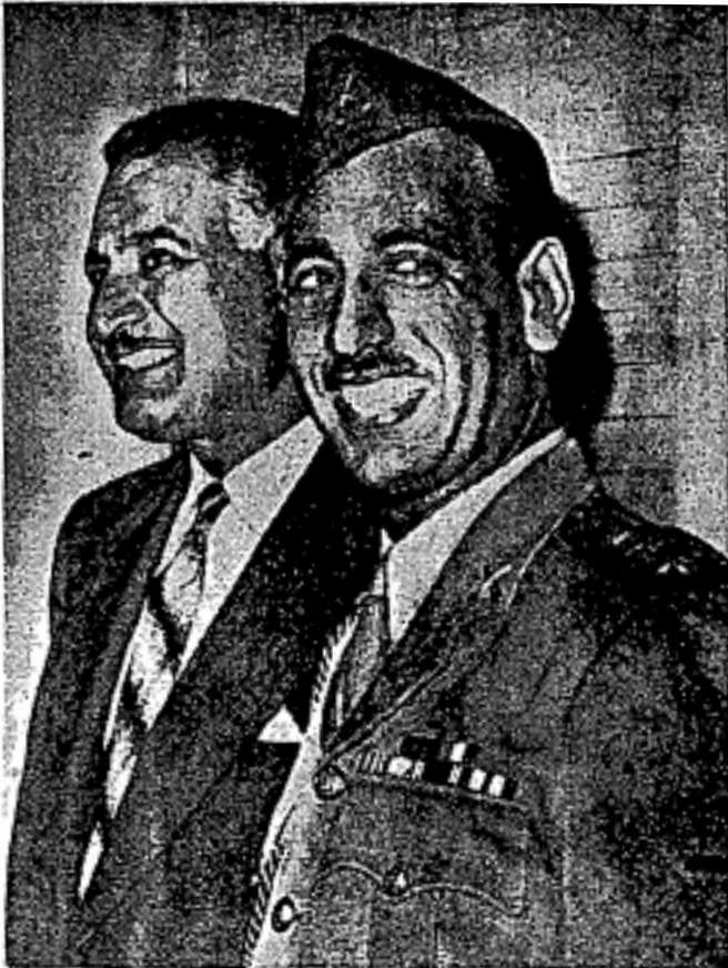
President Gamal Abdel Nasser dan 'Abd ul-Salam 'Arif pemimpin Republik Iraq yang baharu - gambar kedua pemimpin ini diambil sebaik-baik sahaja meletus pemberontakan ke atas kerajaan beraja di Iraq pada tahun 1958.

Lalu berlakulah penyembelihan yang kejam, tak mengenal lelaki atau perempuan, tua atau muda, hinggakan kanak-kanak kecil dan binatang-binatang yang tak berdosa pun mereka bunuh. Sehingga kota Baghdad penuh dengan bangkai manusia sampai ke lorong-lorong yang kecil, penyembelihan masih diteruskan sehingga mengambil masa 40 hari.