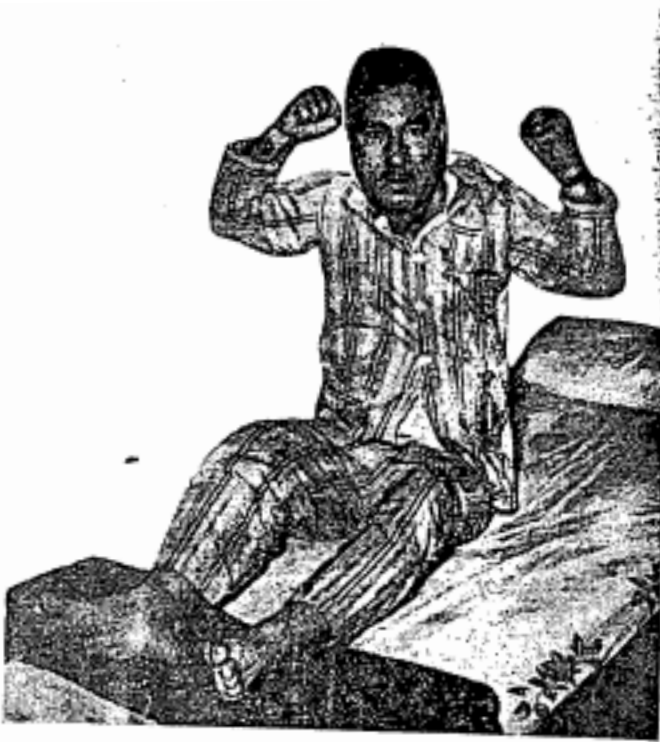
Al-Mahdawi pereka undang-undang kerajaan diktator yang tak perlu mempunyai kelulusan undang-undang.