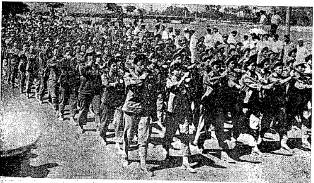
Barisan puteri-puteri Republik Arab bersatu sedang mengambil bahagian di dalam perayaan menyambut Hari Kebangsaan dengan penuh semangat ke tanah airan 1 .