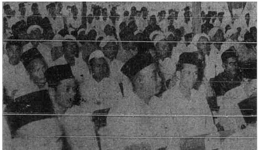
Sebahagian pemerhati dan wakil-wakil bebas di dalam persidangan itu.

Saya berkeyakinan melihat daripada orang-orang yang tetap perdiriannya bahawa cita-cita yang sedemikian itu akan dapat dijalankan dan akan berjalan insya-Allah. Dengan yakin bahawa Allah akan menolong mereka-mereka yang menolong agama Allah adanya.