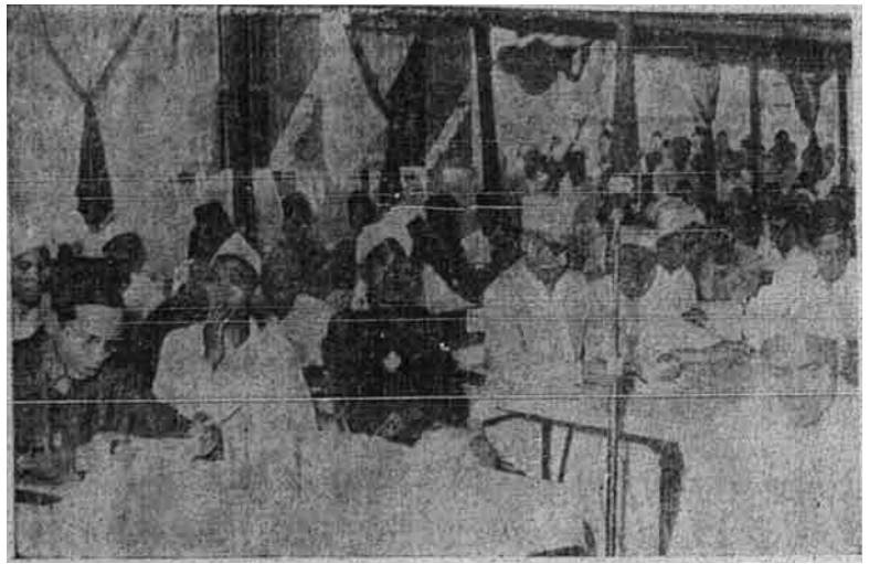
Wakil-wakil yang hadir di dalam persidangan menubuhkan Persatuan Islam se-Malaya

diputuskan bersama itu, sekalipun bersih tujuannya, telah tidak dipersetujui mereka.