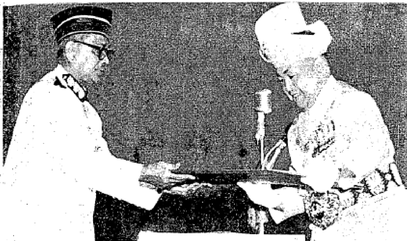
Yang Maha Mulia Yang di-Pertuan Agong sedang menyerahkan Piagam Perisytiharan Malaysia, kepada Perdana Menteri, Tengku Abdul Rahman Putra al-Hajj.