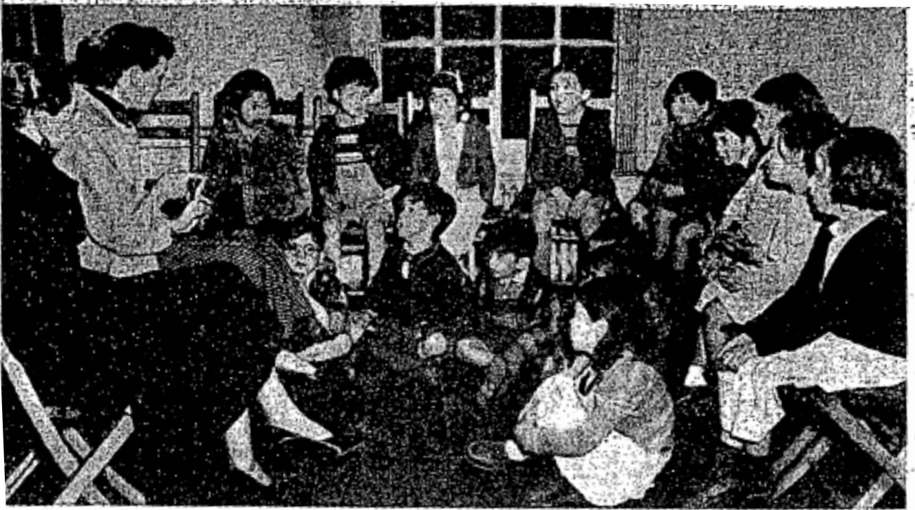
Kelas pelajaran agama Islam yang diberikan oleh seorang wanita di Pusat Kebudayaan Islam di London

kepada sebahagian daripada kanak-kanak Islam.