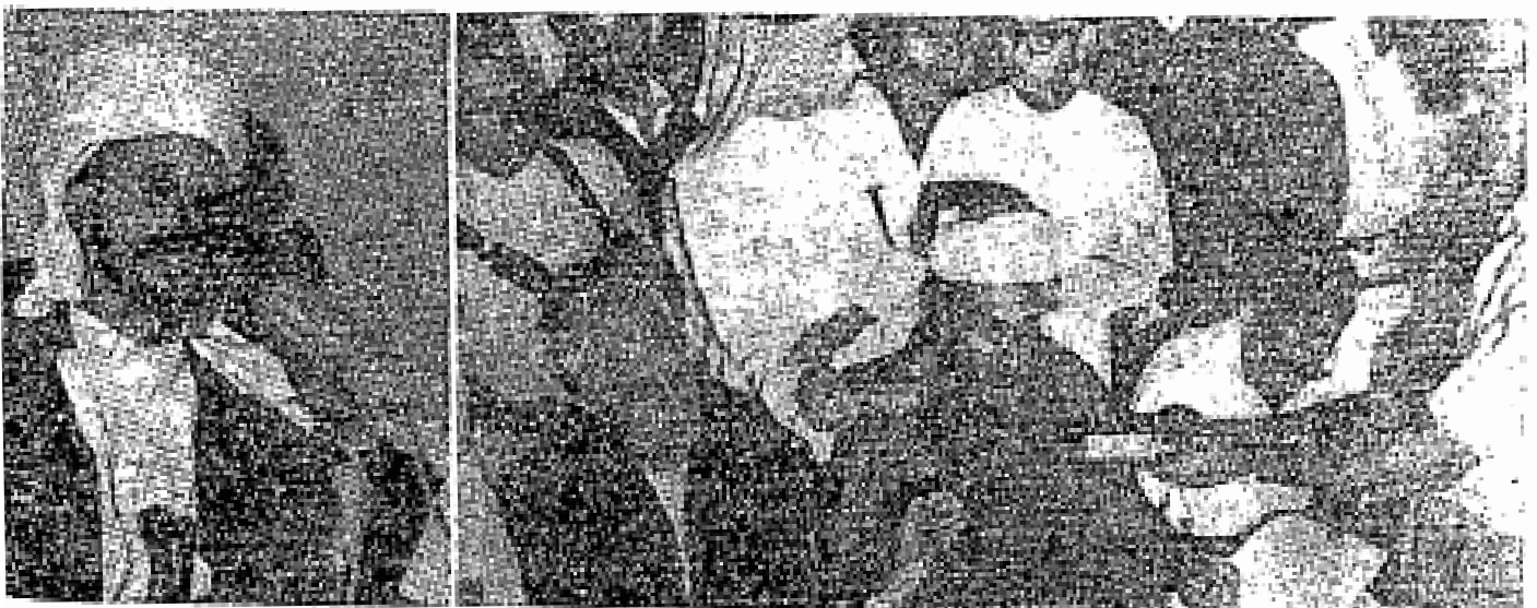
Wakil-wakil di dalam sidang ditemuramah oleh wartawan