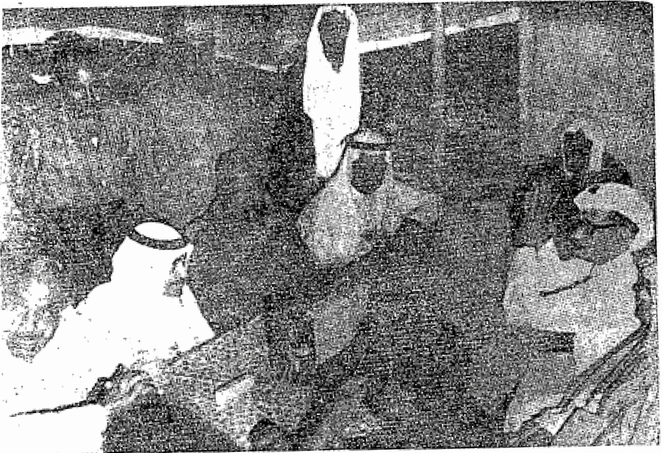
Anggota-anggota pengurus perdamaian dalam sidang di al-Haradh.

Pihak Kebangsaan, dalam perang yang lalu disokong oleh tentera Arab Bersatu dan pihak Raja disokong dengan senjata oleh kerajaan 'Arabiyyah Sa'udiyah