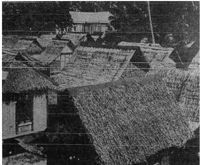
Inilah dia tetapinya! Nun di sana nampak bangunan yang indah sedang yang berjijir berhimpit-himpit itu ialah tempat tinggal murid-murid yang sempit – gambar Qalam.

Inilah sebahagian tanggungan-tanggungan yang besar yang patut diperhati oleh Duli-duli Yang Maha Mulia Sultan yang mempunyai kuasa di dalam perkara agama di negeri masing-masing sedang kuasa itu tidak boleh dicampuri walau sedikit pun oleh pihak pentadbiran British di Semenanjung Tanah Melayu ini. Pentadbiran tentang pelajaran ini sangat-sangat perlu oleh kerana telah difahamkan bahawa di dalam madrasah-madrasah itu telah berlaku beberapa perkara memeras murid dan ibubapa murid samada dengan tepat atau dengan berselindung, samada bertopengkan dengan pengajaran agama atau sebagainya – semuanya mesti