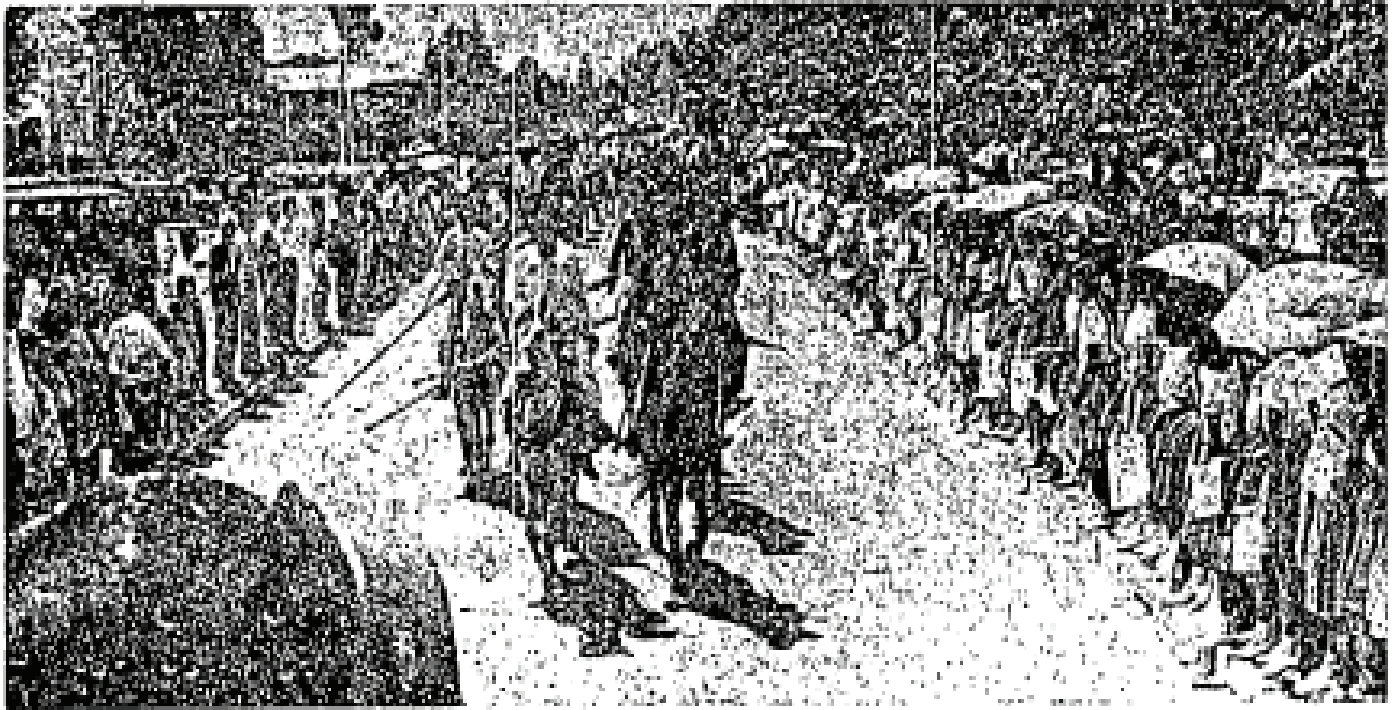
Gambar atas: Dari Lapangan Terbang Jessleton menuju ke istana tempat beliau menginap, Tengku Perdana Menteri telah diarak dengan istiadat berkuda oleh suku Bajau.