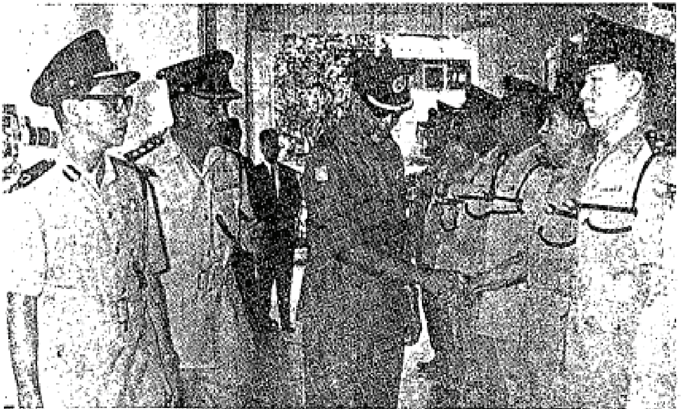
Dalam bulan November 1966 yang lalu Duli Yang Maha Mulia Sultan Selangor telah berangkat melawat ibu pejabat polis dan balai bomba di Klang. Gambar menunjukkan Ketua Pegawai Polis Daerah Klang sedang memperkenalkan pegawai-pegawainya kepada baginda.