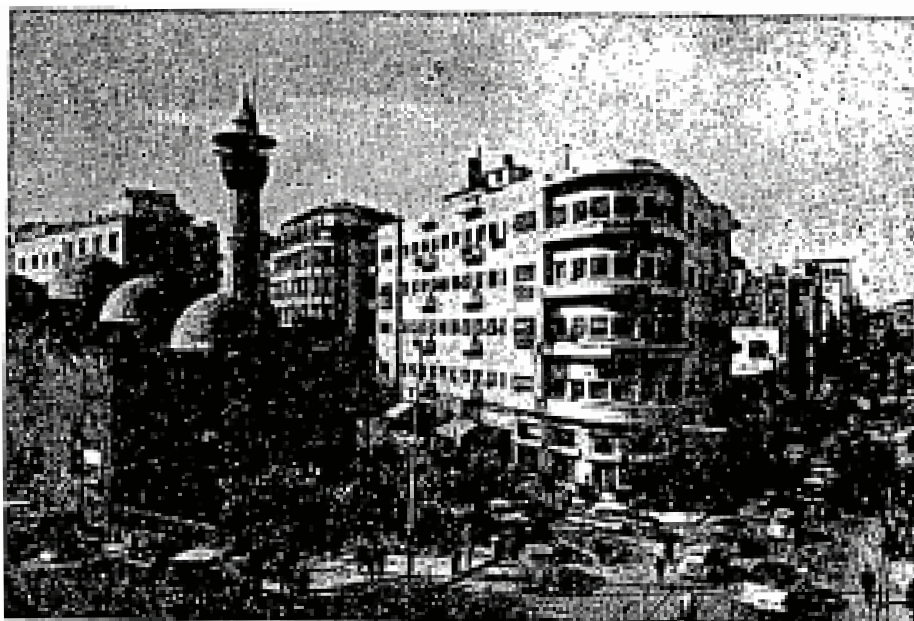
Weygand Street, salah satu jalan raya yang terbesar dan sibuk di Kota Beirut.

Rancang usaha Sungai Litani: Rancang usaha yang besar sekali yang ada sekarang ini ialah rancang usaha Sungai Litani yang dimaksudkan