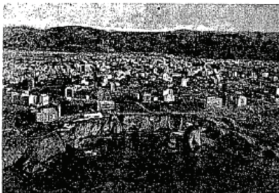
Kawasan "Raouche" Beirut – gambar diambil dari udara.

Sejarah ini dipetik daripada buku: "World Muslim Gazetteer" Yang diterbitkan oleh Umma Publishing House Karachi - Pakistan bagi pihak Muktamar Al-'Alam Al-Islami.