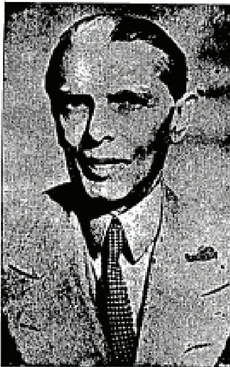
Almarhum Qā'id al- 'Āzīm Muhammad Ali

Barat bolehlah dibahagi kepada tiga bahagian: