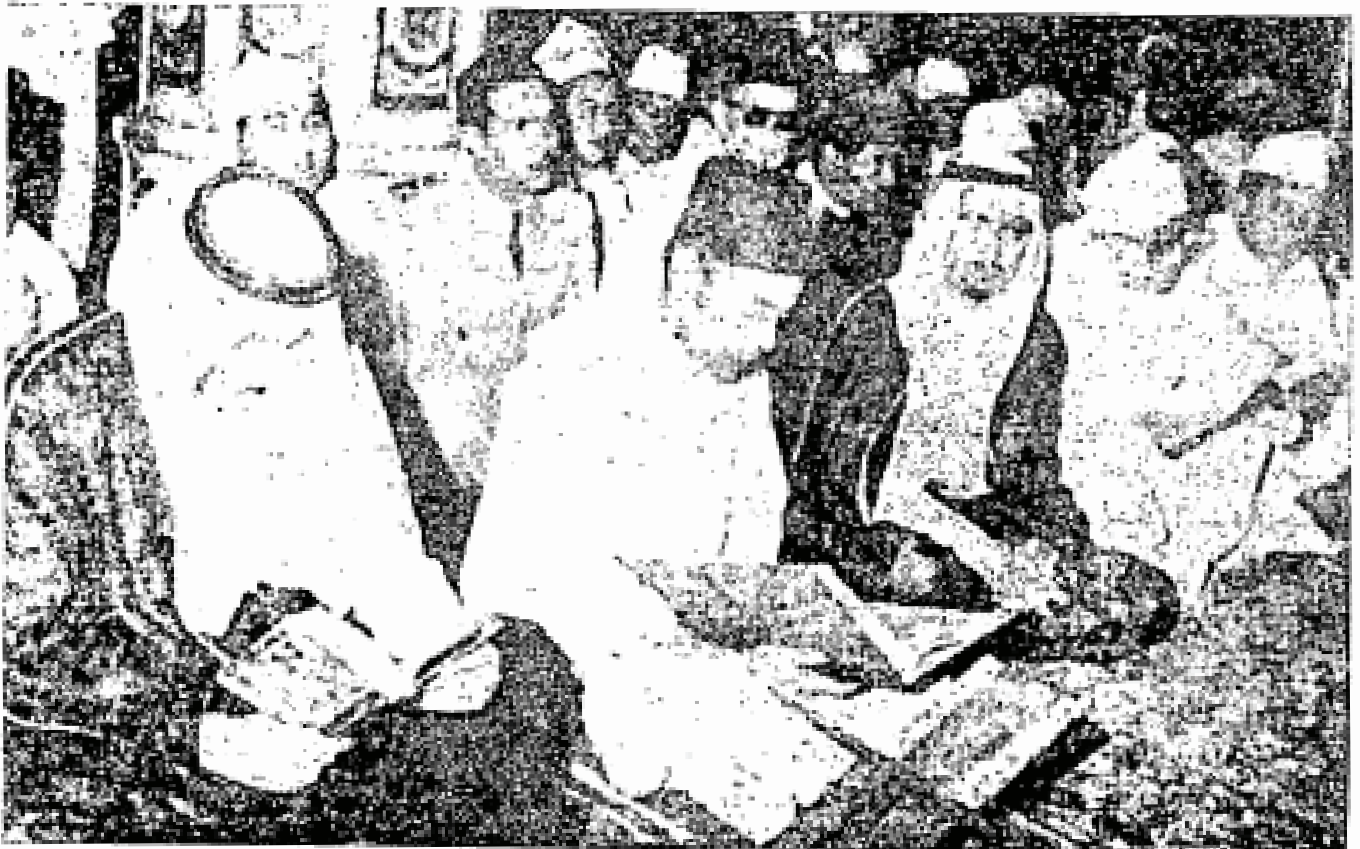
Duli Yang Maha Mulia Al-Malik Husin kedua – Raja Morocco – sedang khusyuk membaca ayat-ayat suci di dalam Masjid al-Rasūl di Madinah al-Munawwarah sewaktu kunjungan baginda ke Sa‘udī ‘Arabiyā beberapa bulan yang lalu.