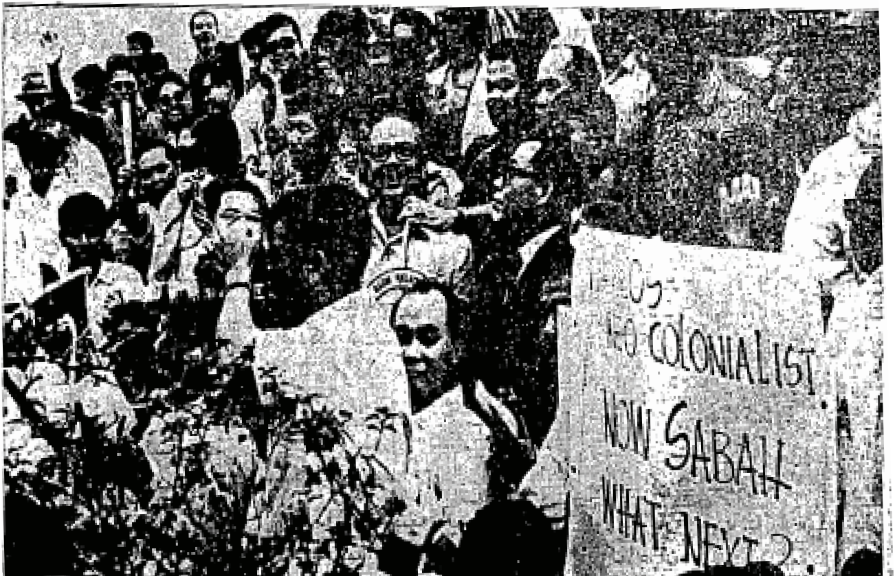
Tengku Perdana Menteri berucap kepada petunjuk-petunjuk perasaan di hadapan Residency .