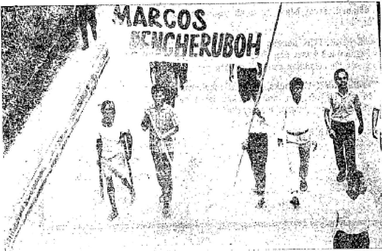
Sepanduk yang mengepalaiunjuk perasaan itu bertulis: "Marcos Penceroboh".