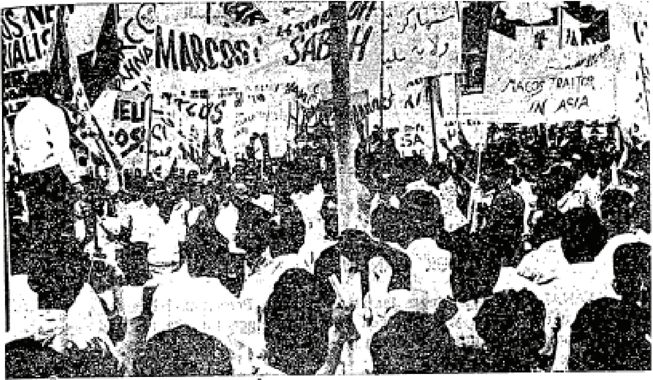
Petunjuk-petunjuk perasaan memulakan demonstrasi mereka di Padang Selangor Kelab.