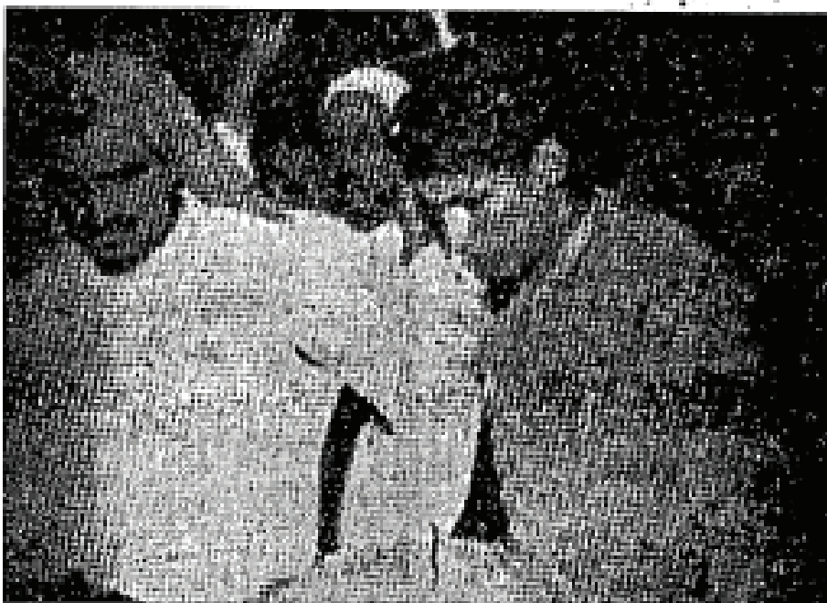
Duli Yang Maha Mulia Amir Mash'al bin al-Malik Abdul Azizi – Pesuruhjaya kota Makkah – sedang mengetuai pekerjaan mengepam air bah dan membersihkan kawasan Masjidil Haram.

Maksudnya: “Agama itu nasihat: “Bagi siapa wahai Rasul Allah?” (Tanya para sahabat) jawab baginda: ‘Bagi Allah, bagi Rasul-Nya dan seumum kaum Muslimin.’”