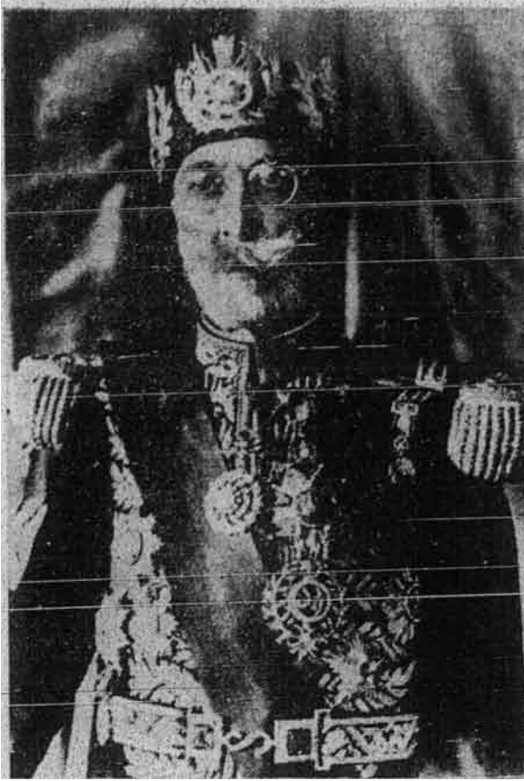
Raja Tunis Syed Muhammad Al-Amin

dan perhubungan Perancis – Tunis akan bertambah buruk sekiranya kerajaan Perancis menyangka akan dapat mengadakan rundingan dan dapat mencapai persetujuan yang baik bagi menunaikan tuntutan rakyat Tunis tetapi bersyarat iaitu hendaklah raja Tunis merombak kerajaan Muhammad Syaniq. Syarat ini – kata akhbar itu lagi – rasanya akan menimbulkan perbalahan yang terus menerus di antara kerajaan Perancis dan Raja Tunis. (Perancis telah pun berjaya dengan menggunakan tangan besinya memaksa Raja Tunis merombak kerajaan yang dipimpin oleh Muhammad Syaniq dan mendirikan kerajaan patung yang tidak di terima oleh rakyat dan inilah yang menyebabkan kedudukan Tunis makin bertambah kacau – P)