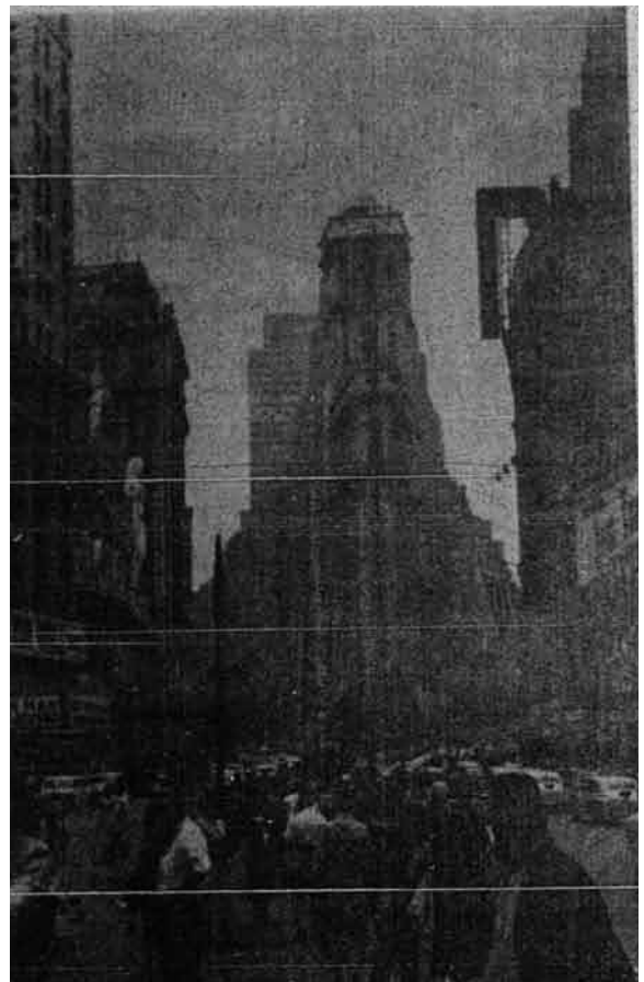
Times Square New York bangunan yang tengah-tengah itu Ialah pejabat akhbar New York Times sedang di tengah-tengah jalan motorak dan manusia penuh sesak.

Maka pembaca-pembaca janganlah menyangka bandar New York yang sunyi oleh kerana setengah penduduk-penduduknya keluar pergi ke tempat lain mengambil angin, dan kerana kedai-kedai panggung-panggung wayang dan sekolah-sekolah ditutup. Sesungguhnya di New York dalam musim