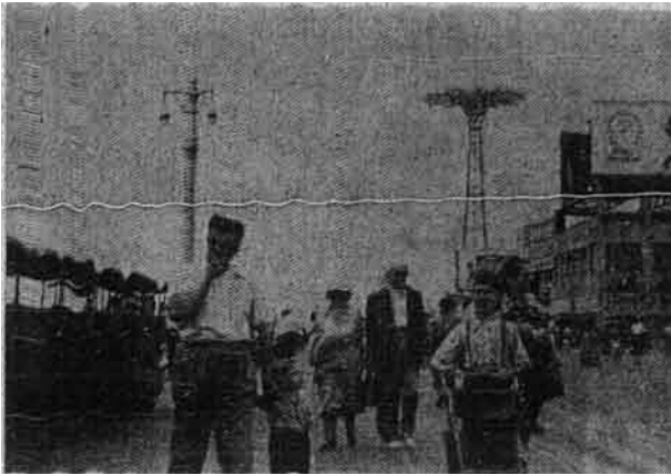
Tempat bermain-main dan mengambil angin dalam musim panas Kota Island, New York.