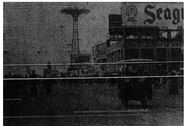
Satu pandangan lagi Coney Island iaitu tempat penduduk-penduduk New York pergi mengambil angin dan mandi laut.