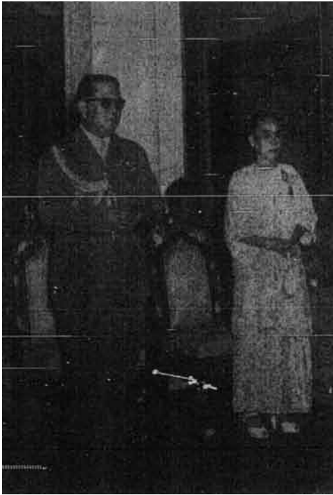
Tengku Mahkota Johor sedang berdoa.

Pada 2 September yang lalu usia Sultan Johor telah memasuki 79 tahun dan sebagaimana biasa hari itu disambut dengan rasmi di Johor yang di dalamnya diadakan pula istiadat menyampaikan hadiah-hadiah pingat jasa.