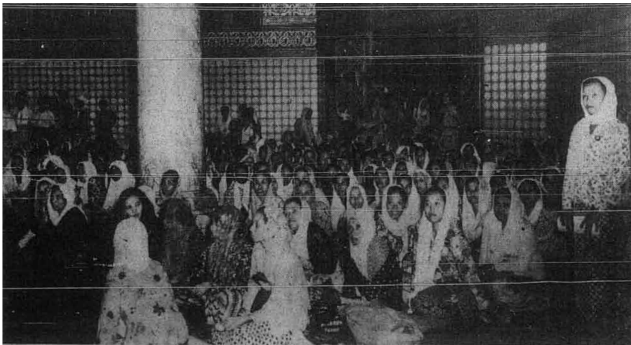
Kaum ibu yang hadir mendengar muktamar alim ulama dan mubaligh Islam di Medan baharu-baharu in. Mereka ditempatkan di suatu tempat yang tertentu –gambar “Raya” Foto servis Medan.

Daripada dua ayat yang tersebut di atas ini dapat kita mengambil pelajaran yang mustahak supaya berani menegaskan kebenaran berhadapan dengan sesiapa jua pun. Bukannya sahaja Rasulullah berhujah dengan manusia sekali dua bahkan kerap kali dan begitu pula sahabat-sahabatnya; sebab tidak ada sedikit ayat-ayat Quran sebab banyak ayat-ayat Quran yang isinya berhadapan dengan manusia. Di dalam perbahasan-perbahasan itu Rasul Allāh ṣallā Allāh ‘alaih wa sallam sentiasa mendapat kemenangan- dengan tepatnya bahawa musuh tak dapat menjatuhkan kebenaran. Ini semuanya tidaklah sebabnya melainkan yang dibawanya itu kebenaran