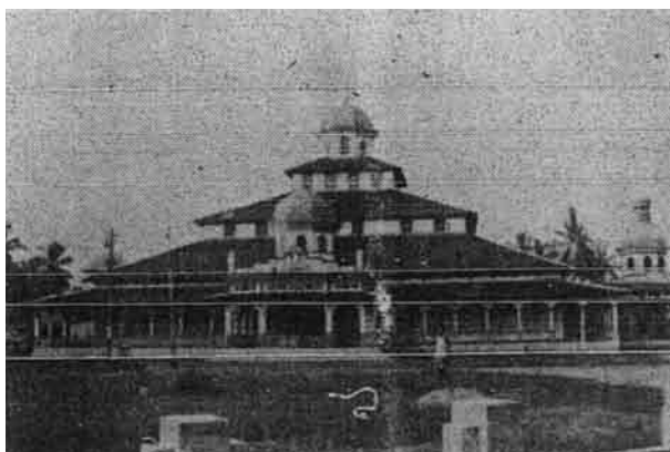
Gambar masjid Banjarmasin yang baharu yang terletak di pertengahan bandar. Masjid ini besar dan cantik rupanya. Atapnya dibuat daripada kayu (blend) dan dindingnya dibuat daripada papan

Kurangnya pengertian kita kepada masjid itu adalah tersebut banyak ajaran-ajaran Tuhan di masjid itu tidak dapat difaham, tidak dapat difaham itu ada kalanya diterangkan dengan bahasa yang tidak difaham oleh pendengar-pendengarnya sehingga dengan itu ada yang mengira masjid itu tempat memperbodoh