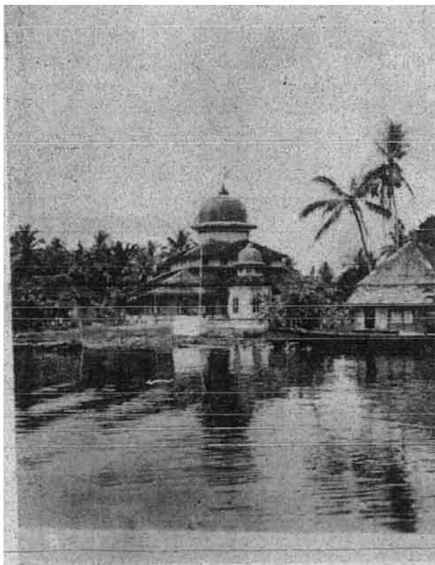
Gambar masjid Banjarmasin yang lama yang terletak berhampiran tepi sungai.

Sampainya di Madinah pekerjaan yang pertama dilakukan oleh Nabi ialah mendirikan masjid iaitu pada tahun 632 Masihi dan di masjid itulah Nabi memulai rancangan