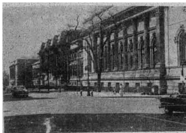
Sekolah gambar “Metropolitan Museum of Art” New York

“Orang Greek menulis dengan jalan menggerakkan tangan dari kiri ke kanan; akan tetapi orang-orang Mesir dari kanan ke kiri. Dengan membuat demikian mereka berkata bahawa mereka membuat cara kanan, dan orang-orang Greek cara kiri..... Daripada sekalian manusia mereka itulah satu puak yang sangat mengambil berat dan setia menyembah Tuhan, dan mereka mempunyai ibadat rasmi seperti berikut. Mereka minum dari mangkuk tembaga, yang mereka bersihkan tiap-tiap hari, dan ibadat ini tidaklah hanya diikuti oleh setengah orang, dan tidak diturut oleh setengah lagi, tetapi semua mereka