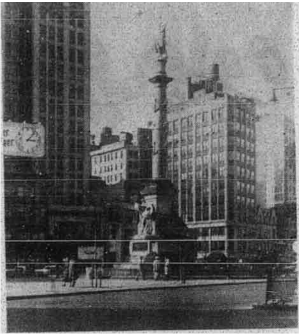
Patung Columbus dalam kawasan Columbus Circle, New York.

burung-burung unta dan kuda belang negeri Afrika, kanggaru negeri Australia, burung-burung penguin dari kawasan dingin di selatan, kambing-kambing hutan yang berkediaman di kawasan pergunungan banjaran Alps; beberapa jenis ikan yang didapati dalam lautan-lautan dunia dan bejenis-jenis binatang yang halus.