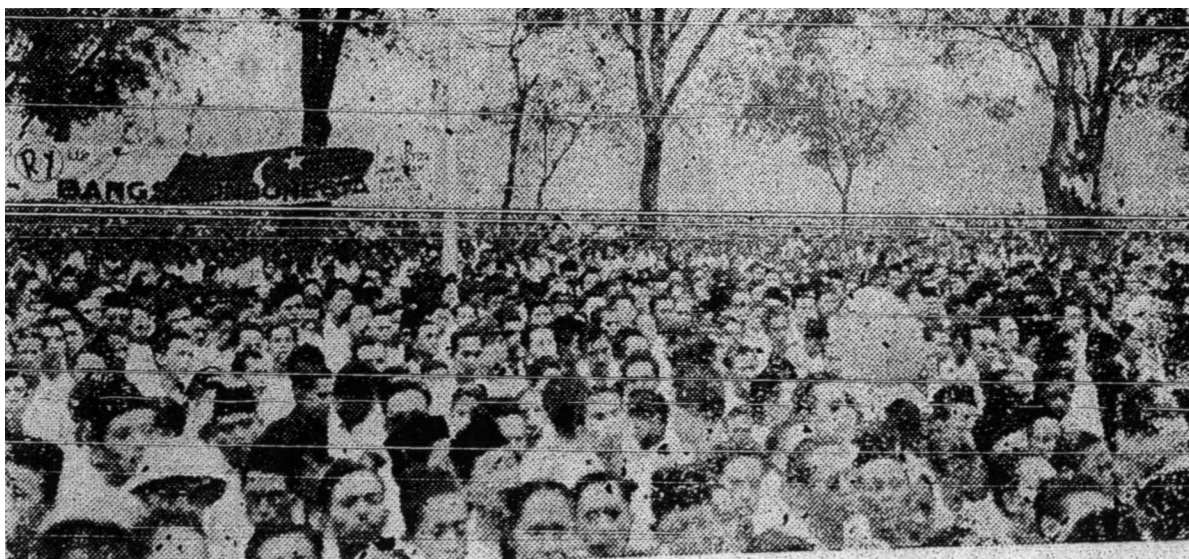
Beribu-ribu manusia yang hadir di dalam perayaan sambutan kemerdekaan Indonesia di Jakarta di hadapan Istana Merdeka itu adalah menunjukkan bagaimana semangat dan roh mereka telah menyerap ke dalam darah daging mereka. Merdeka ertinya merdeka bagi segala penjajahan dan pemerintahan negeri mereka adalah untuk bangsa dan tanah air mereka – bukan untuk faedah orang lain.

Dengan keadaan sekarang – setelah terlepas segala penanggungan yang hebat yang cuba merampas hak Melayu itu telah terlepas maka maslahat rakyat jelata itu hendaklah dipertahankan bersama-sama berhabis-habisan – jangan nafsu-nafsi masing-masing memalingkan belakang dengan berkata “aku apa peduli bukan