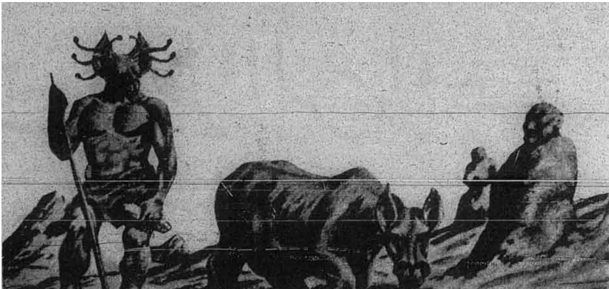
Penduduk Bintang Musytari (Jupiter)