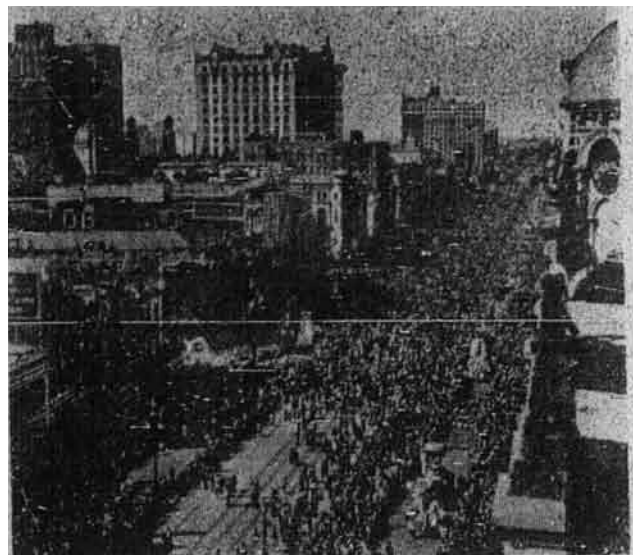
Di bandar New Orleans setahun sekali ada keramaian yang pertama Mardi Gras. Gambar di atas menunjukkan perarakan dalam keramaian itu melalui jalan raya Canal Street. Orang dari seluruh Amerika pergi ke New Orleans kerana hendak menyaksikan keramaian itu.

Bas kami itu, iaitu bas Inggeris yang berjalan terus dari Richmond ke Atlanta dan New Orleans, telah sampai di bandar Atlanta pada pukul 12 tengah malam. Saya turun di sini lalu berjalan mencari hotel, sekejap sahaja saya nampak iklan sebuah hotel yang bernama "Travellers Hotel" dan dengan tidak lengah lagi saya pun menuju ke hotel itu. Apabila saya masuk ke dalam saya dapati