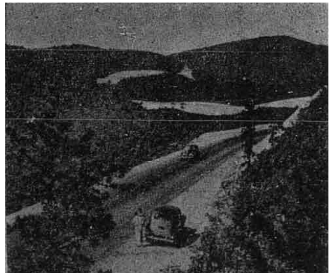
Satu Pemandangan yang indah di kawasan yang bernama Shenandoa Valley Virginia.

bangsa Amerika yang bekerja di situ telah datang mendapatkan saya lalu mengambil beg itu dari tangan saya. Lepas saya mendaftarkan nama saya pun dibawa naik lipat pergi ke bilik. Bilik itu besar, elok perhiasannya, katil pun besar, dan di atas sebuah meja saya lihat ada sebuah kitab Injil. Pada malam itu saya telah tidur dengan hati yang cukup lapang dan senang. Pada pagi-pagi esok saya keluar dari hotel Juan Marshall itu kerana hendak menunggu bas ke Atlanta. Kerani yang menjaga di hotel itu telah hairan melihat saya keluar pagi-pagi itu lalu bertanya saya tak mahukah melihat-lihat bandar Richmond. Saya menyatakan dukacita saya tak dapat membuat demikian kerana saya hendak berjalan jauh ke selatan Amerika Syarikat. Jika saya balik katanya singgahlah di hotel itu sekali lagi. Di sini