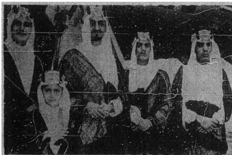
Al-Amīr Fayṣal Bin ‘Abdul ‘Azīz (Menteri Luar) bersama anak-anaknya.

Pada 26 Disember 1915 buat perjanjian persahabatan telah dimeterikan di antara Ibnu Sa‘ūd dengan kerajaan