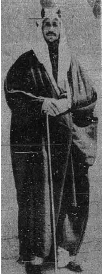
Al-Malik Sa'ūd Ibnu 'Abdul 'Azīz Raja baru Saudi Arabia

kerajaan ayahandanya dan menewaskan musuhnya.