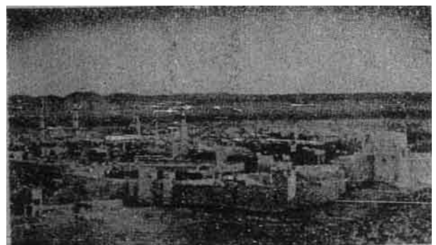
Bandar Madinah dipandang dari udara.

Perkara yang kesepuluh: Perjanjian ini ditulis dalam dua bahasa: Arab dan Inggeris, nas perjanjian itu dalam kedua-dua bahasa adalah sama harganya, tetapi apakala berlaku pertelingkahan pada memahamkan sebahagian daripada kandungannya maka hendaklah berbalik kepada nas yang dalam bahasa Inggeris.