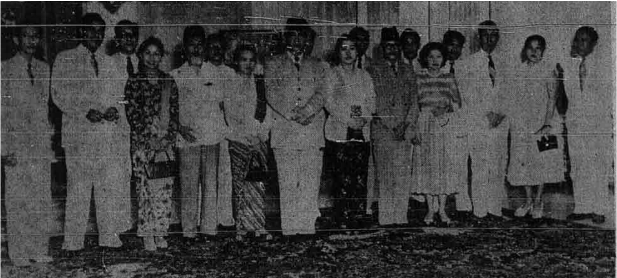
Presiden Sukarno bersama-sama isterinya serta menteri penerangan menyambut ahli-ahli jawatankuasa untuk menghapuskan penyakit paru-paru yang sangat-sangat bermaharajalela di Indoensia.