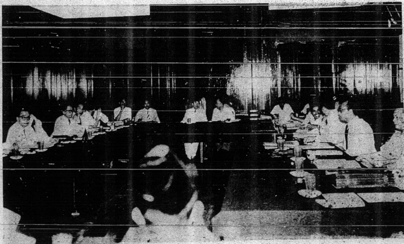
فرسيداغن يفتله بمباوا فرستوجوان دانتارا دوا فمرنتاهن يفتله دادكن فد 15.8.50 دفجابه منترى لوار دجاكرتا.