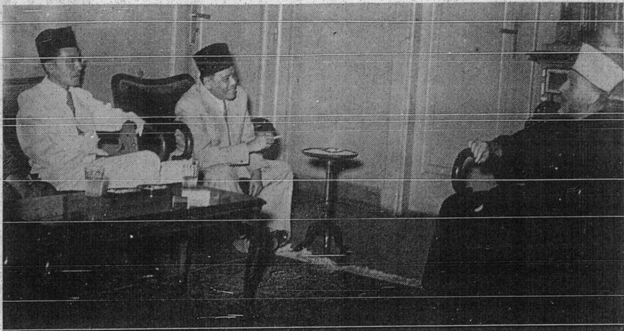
كدوا ۲۱ ورتاون ايت (توان اسا بافقيه، توان حمكا دتغه) تيدق لوف منزيارهي مجاهد اسلام يفتكر كتل دسلوره عالم اسلامي يايت الحاج امين الحسيني مفتي فلسطين يغب فد ماس اين اد دمصر.