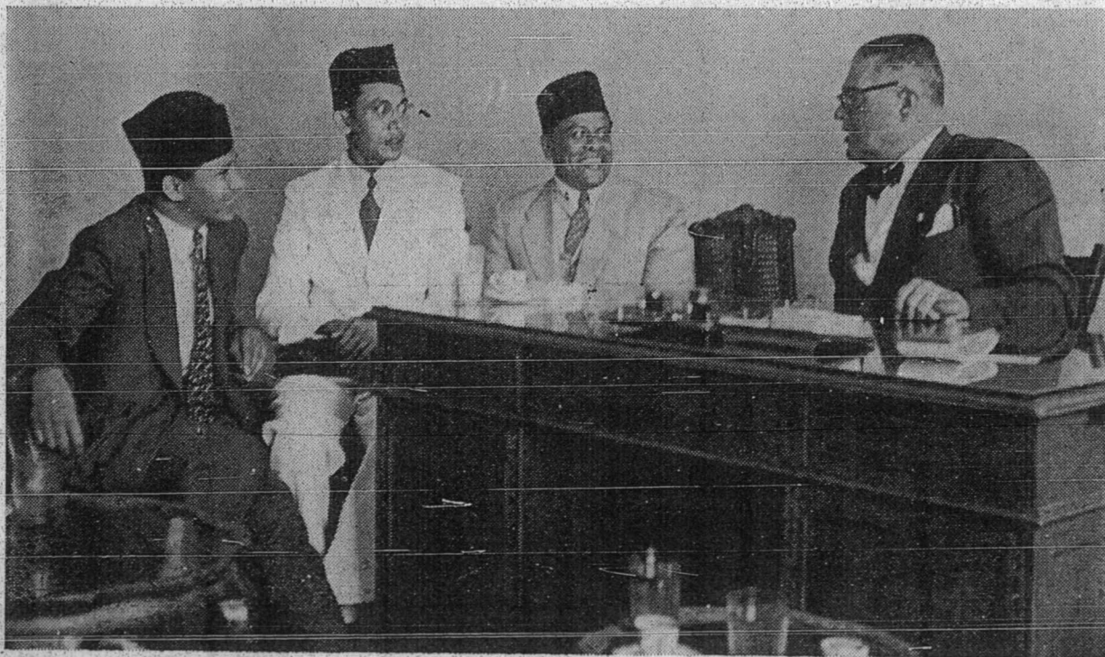
كالمو ورتاون دغن ورتاون برجمفا ياسن ليه مرياه . ليهتهله كدوا ۲۱ ورتاون ايت برجمفا دغن توان فكري اباظه باشا كتوا فغارغ مجله ، المصور ، ددالم فجايتن ( سبله كانن ) دان يفترتاوا ايت اباله توان حمكا برسام ۲ دغن توان اسا بافقيه ( باجو فوتيه ) . - گمبر ۲ محمد مستور زهري مصر خاص كران قلم .