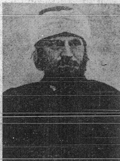
السيد جمال الدين الافغاني