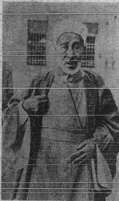
المرحوم الشيخ مأمون الشناوي شيخ الازهر يفتله منيغكل بغ تمفتن دكتيكن اوله الشيخ عبدالمجيد سالم

سبايق 10 فأون مصري تيف 2 بولن سباكي مغير كاكن جاس دان كحرمانن كفدان. دغن ايت ايضون منتفكن نيتن تتف دودق دمصر. اقبيل ترسيار بريرت تتغ كتيائن ايت مك راميله فنتوة 2 بغ ايغن هندق بلاجر كفدان داتغ كررمهن. كقد فنتوة 2 اين داجرن بيراف كتاب يغ تيغكي 2 تتغ توحيد، فلسفه، اصول الفقه تصوف دانسباكين.