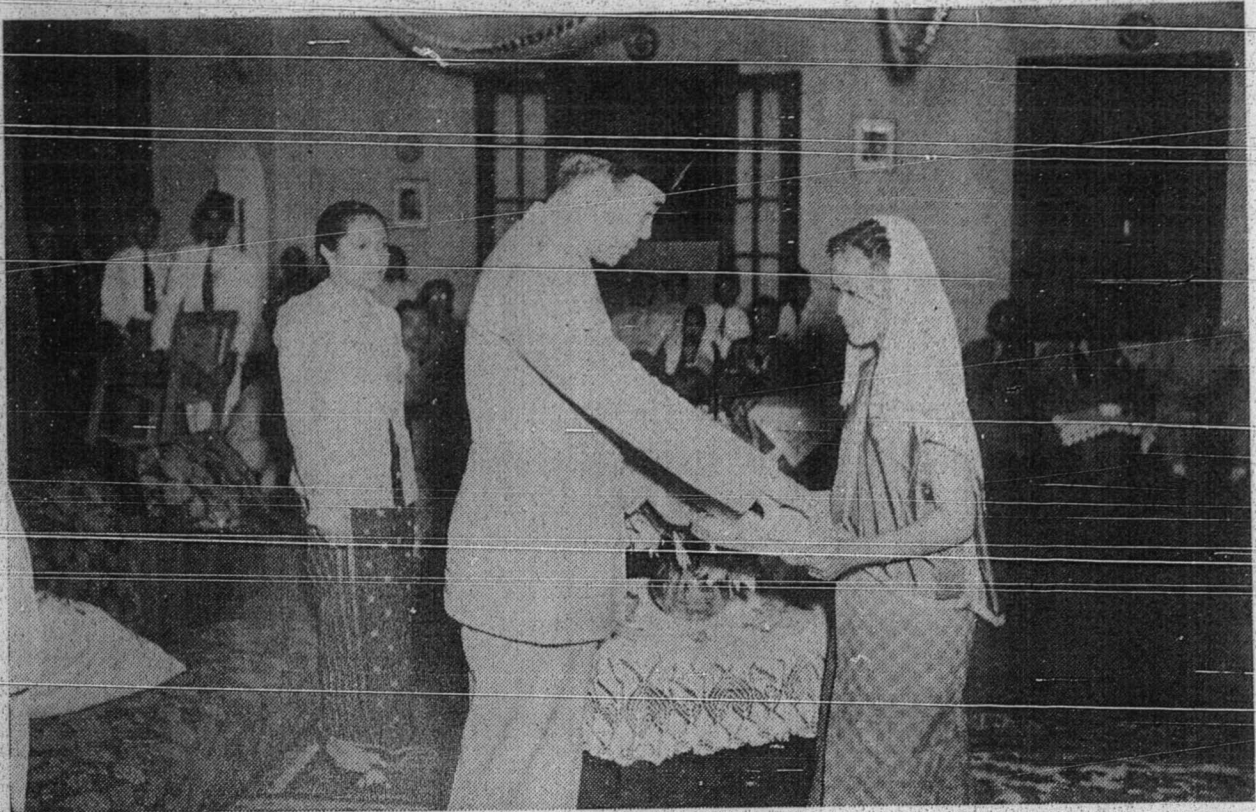
فريسيدنه سوكرنو اداله كرفكالي مريما هديه ۲ درقد رعية ييغ منجوقكن چننا مريكشيت كفا فريسيدنه. كمبر منجوقكن فريسيدنه سدغ مريما هديه .