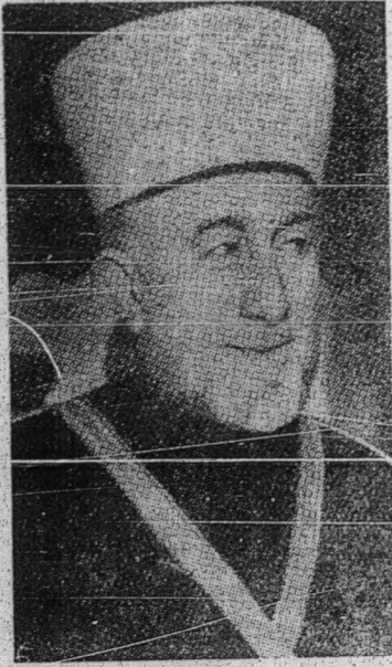
صاحب السماحة الحاج امين الحسيني مفتي فلسطين وفروسي موہ تمر العالم الاسلامی .

دباوه این کیت فتورنگن اوچافن صاحب السماحة الحاج امين الحسيني مفتي بسر فلسطين سباکي ففروسي فرسیداغن موہ تمر العالم الاسلامی بغدادکن دکاراجی فد 9 ففبرواری 1951 ددالمان بلیو تله مغادکن سروان سفای اومه اسلام بکرج کرس منچافی کساتوان اسلام منوره فرنته الله یأیت: «بسا این هان سان ساتو سهاج» بلیو مبیوه جوک ددالم اوچافن ایت توجه فصل یغ ساعۃ مستحق یغ فانتوه دکاجی اوله تیغ ۲ سندي مشارکۃ اسلام باکي منچافی توجوان آ یغواتام انتوه مبایککی دان مغهالوسی فریحال دان کدودفکنن فد ماس یفاکن داتغ سفای اسلام بفکیه سمولا یفاکن مباوا کعادیلن ددالم سرسربی معنائ دغن تیدق شک لاکي فرهاتيله اوچافن بلیو یغدفتورنگن دباوه این دغن سقسام مدهمداهن ممبری منفعۃ کفد کیت:۔