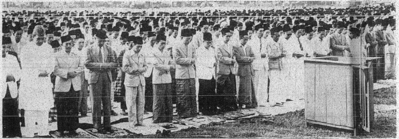
موا تان ساتو می نتافی ی بتافلکه یغ بوکن یغ 1951 صمد روم ی خطیب