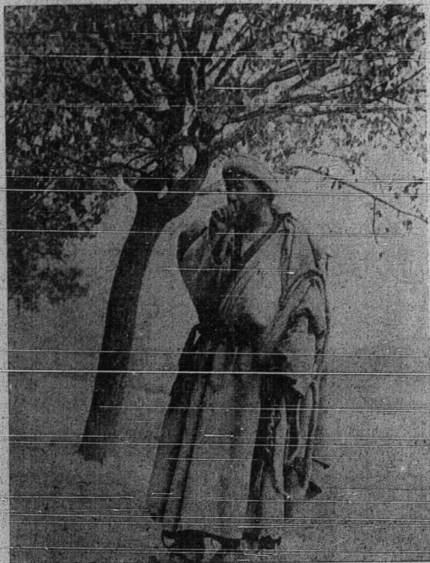
درفد گمبر این نمفق دغن ترغن منجوقکن کادان دان قدریتان اورغ ۲ اسلام دکشیر.