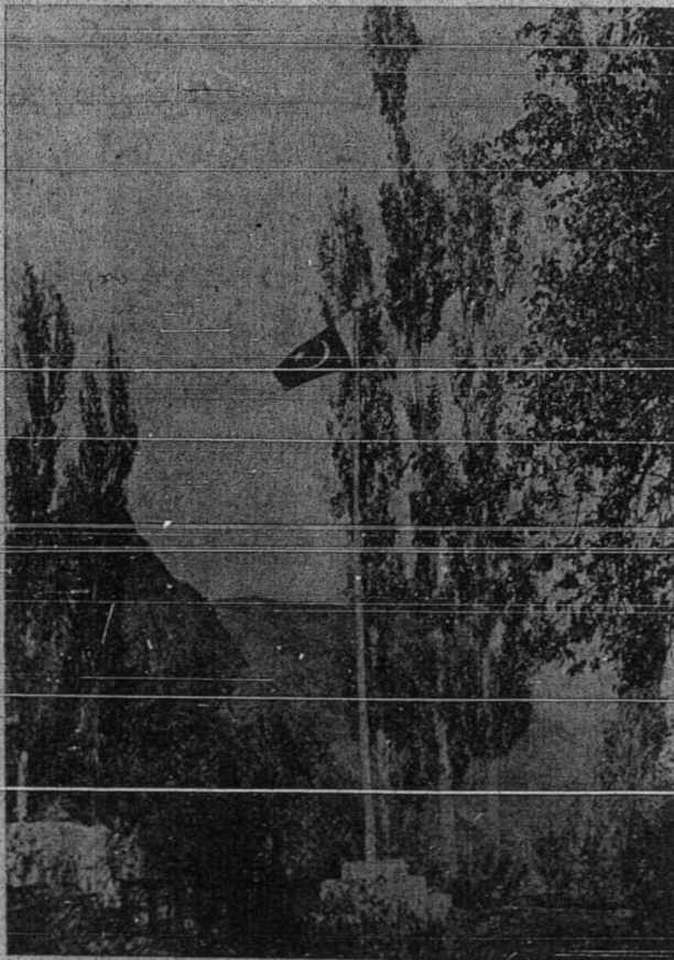
بنديرا فاکيستان تر ديري ددالم کواونن کشمير .

تيميق تيميق کاتس اورغ رامی تله دلاکوکن دلوار مسجد سر دان بر ايت ۲ تله ددافي بر کنان دغن تيميق تيميق يغلداکوکن دکن ۲ کچيل دان دکمفوغ ۲ دالم لمباهن ايت .