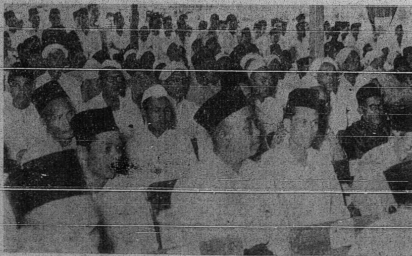
بهباکین فمر هاتی دان وکیل ۲ بیس ددالم فرسیداغن ایت .

سای بر کیقین مایهه درزد اورغ ۲ یغ تنف فر دیرین بهوا جیتا ۲ یغ سد مکین ایت اکن دافه دجالنکن دان اکن بر جانلن ان شاء الله . دغن یقین بهوا الله اکن منولغ مر یک ۲ یغ منولغ اکام الله ادان .