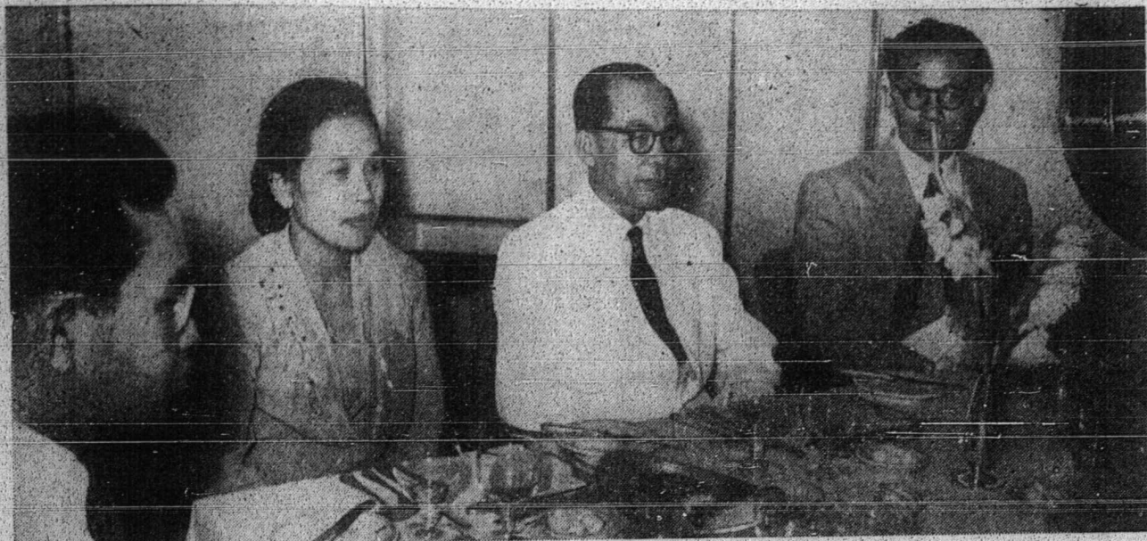
دقتور محمد حتی (دتفه) دان دکانتن پو بار زریف سرت دکیرین دقتور رزیف قبصل اگوغ اندونیسیا دسیغافورا

دقتور محمد حتی برسام ۲ رومبوغنن یغ هندق منوجو کسخترا تله نیا دسیغافورا فد 52، 20 دغن اِسمبوة اوله دقتور محمد رزیف دان توان ملکوم میقدونالد سرت سوداگر ۲ اندونیسیا.