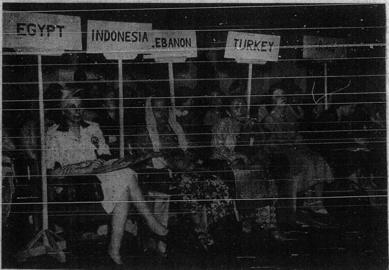
سبھاڪين درفد وڪيل ۲ يھداننتاران (بغ ڪموق) ايباله سيني نورجنه دري اندونيسيا - ڪمبر ۲ خاص دري فاكستان.