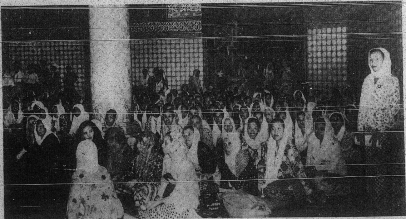
قوم ایبو یفحاضر مندغر موه تمر عالم تلماء دان مبلغ اسلام دمیدان بهارو ۲ این . مریک دتمفتکن دسوات تمه یغترنتو - گمبر "رای" فوتو سربیس میدان .

سب ۲، بوقی یغ دکوناکن اوله رسول الله اتو برحجه دان مستفکن کینارن ایت ایاله القرآن یغددالمن ترکدوغ کتراغن یغ جلس دان بات تنغ کرسولنن دان کینارن یغداوان دري منجق ایت تاد سئورغ فون یغ سغکوف مینته، میالهکن دان مموایه سوات سورة سهاج سأمفمان سهگک هاری این بهکن هگک هاری قیامة نتمی - دهافن مانسی یغرباکی ۲ ماچم کادانن الله تله عمرته کفد نبی محمد صلی الله علیه وسلم مچاکن و حیون (مقصودن): "کناکنله اکو تله دتکه میمبه برهالا ۲ یغ کامو سیمه بلاین الله کناکنله - اکو تیدق اکن ایکو کهنیق کامو سغکوهن کالو اکو ایکو سستله اکو دان بوکنله اکو درفد اورغیغ دافه فرتنجوق"