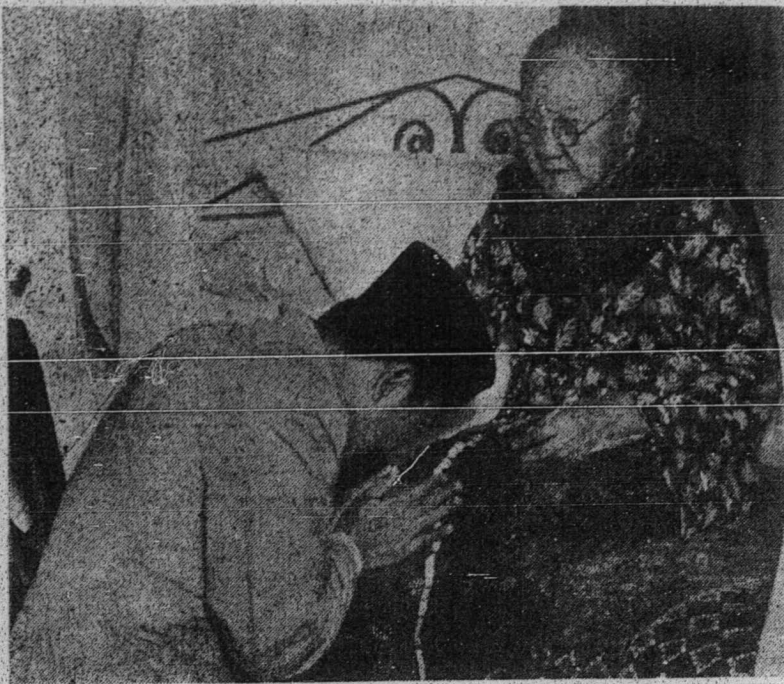
فريسيده سو كرونو سدغ برهاري براي دغن ايون

فرمان الله: لا تعبدون الا الله (مقصودن) جاغمله كامو سبه سلاين درفد الله