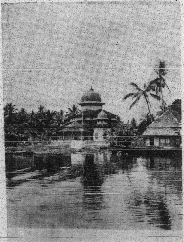
گمبر مسجد بنجرماسین یغلام یغفرلئق برهفقیران نفی سوغی - گمبر قلم.

سمنین دمدینه فکر جان یغفر تام دلاکوکن اوله نبی ایاله مندریکن مسجد یأیت فد تاهون 632 مسیحی دان دمسجد ایتوله نبی ممولای رنچاغن