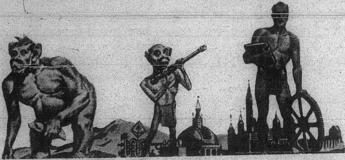
فندودق بښتغ زهره (Venus)