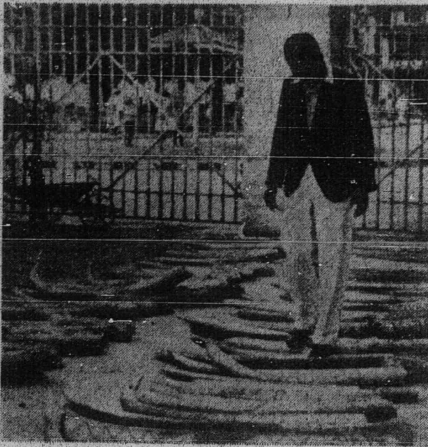
کادېغ ۲ کاجه اداله دباوا دغن بايقن کز نزيبار دري سلوره بنوا افريکا، دان دري سان دفرنيکاکن کلوار نگري.

بلوم فون مولا بکرج لاکي واغ بلنجا سده داميل دان هابيس. اينله يقدکات اوله اورغ چينا: "هاي يا! اولغ کولايو ميغوغ! کيليچا ساتو تاوعون ماء و ماکن لوا تاوعون!"