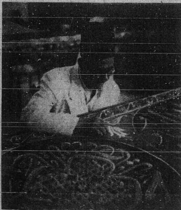
سثورغ فكرج يغ ماهر سدغ منكة دغن تكونن .

ارتين : ” كامو اكن دودق دالم كادان دكجي اورغ دان كفقان . “