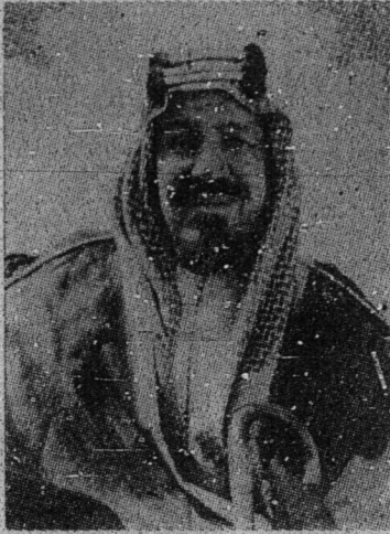
المرحوم الملك ابن سعود

الملك عبدالعزيز ابن سعود، راج حجاز دان نجد (سعودي عربيه) تله مشكاة فد هاري احد 1 ربيع الاول 1373 (8 نوبمبر 1953) داستنان دطائف دان تله دمقامكن دبندر رياض فد هاري اثنين - اسوقن .