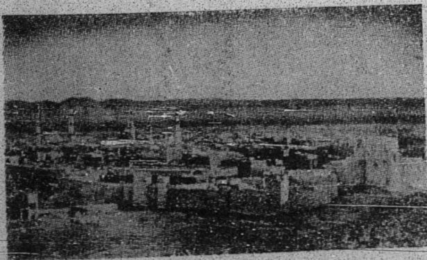
بلدر مدينه دفلدغ دري اودارا.

فرکارا بگکسميلن: دغن فر جنجين بغيرهارو اين مک فر جنجين لام بقتله دمتر يکن دانتارا کدوا بله فيهق فلد ۲۶ دسيمبر ۱۹۱۵ دحکومکن منسوخ. فرکارا بگکسفوله: فر جنجين اين دتوليس دالم هوا بهاس: عرب دان اغکريس، نص فر جنجين ايت دالم کدوا ۲۱ بهاس اداله سام هر کان، تنافي افکل بر لا کو فر تليغکا هن فدمهمکن سبها کين درفد کندوغن مک هندقله بر باليک کفد نص بگد دالم بهاس اغکريس.