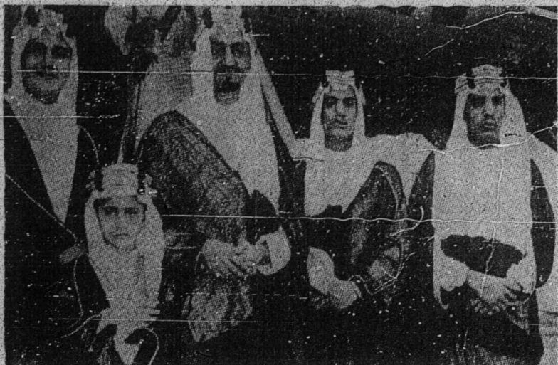
الامير فيصل بن عبدالعزيز (منتريلوار) برسام انقن ۲.

فرکارا يفتوجه: شورغ نائب عام هندقله دلنتيق اوله دولي بغمها مليا دان ببراف کتوا جباتن منوره يغدکهندقکي اوله کادان.