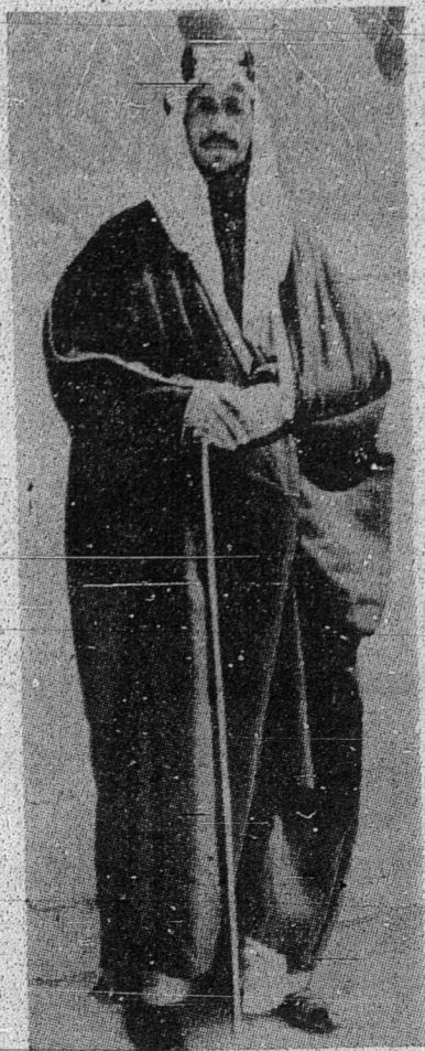
الملك سعود ابن عبدالعزيز راج بهارو سعودي عربيه

نگارا سعودي عربيه ترديري در فد دوا بواه نگري ۲۲ ماسيغ ۲۸ مفيو پاي فمر تاهن يغبر سندیري فر تام : نگري نجد، ايوو نگرين اياله بندر رياض دباوه فر تاهن الامير سعود (فترا مهکوت يغ سکارغ منجادي راج بهارو) کدوا نگري حجاز، ايوو نگرين بندر مکه دباوه فر تاهن الامير فيصل تتافي کدوا ۲۸ تيدق منجالنکن سوات فر کارا مليکن منله دکهوي دان دلوسکن اوله راج ابن سعود