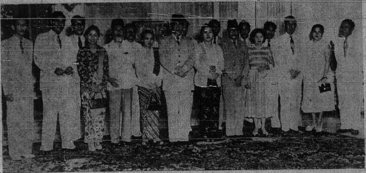
فرسيده سوکرتو برسام ۲ استرین سرت منتری قراهن میبوه اهل ۲ جواتکواس انتوی مغهافوسکن فباکینه فارو ۲ یغ ساغه ۲ برمهراجلیلا داندونیسیا .