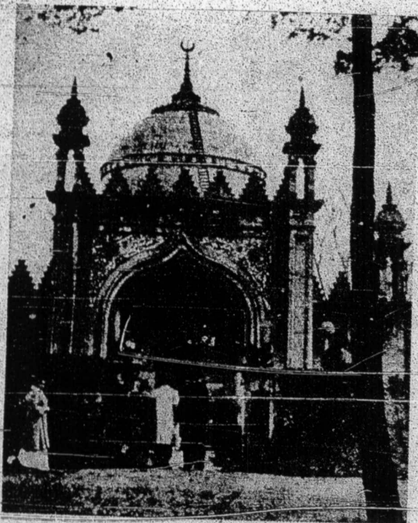
مسجد "شاہ جہان" سیواہ باغونن اسلام یغرتوا دا اٹکلند

افیل کیت ہندق مٹکاجی سجارہ ترسیارن اسلام دا اٹکلند مک سدہ تنو اکن بر تمو دغن نام کفتن فلیمیغ لیدی ہیستر ستینہوف دان لیدی ایلینرا دالم تاهون ۱۸۷۵ لورد ستیندیغ اوف الدرلی تلہ مملوق اسلام داستانبول لالومیندیغ نام عبدالرحمن ای تلہ منیغکل دالم تاهون ۱۹۰۳ دان تلہ دقورکن