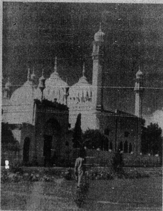
مسجد جناح دارالعلوم دفاشاور سالا سبواه مسجد يغ انده دفاكيستان يغ منجادي چوگن كيسارن اسلام.

تيف ۲ حكوم يفتله تور نكن الله احكم الحاكمين ادله حق مطلق كيت اومه اسلام سلورهن، داس كيت اومه ۲ اسلامه واجب ممفرتاهنكن كسوجين جك دنوداي، ييلا كجر ماتن جك دجابولي، كالو كيت هان برفوق توبه دان كو يوغ ۲ كاكسي مهاج مليهتن فقهينان دان كجابولن يهاكن دفوفو، كن اورغ كاتس داسر اوندغ ۲ اسلام يهمليا، مك سكل تفكوه جواب دان كنجارنن اكن كيت تر يماسهاجاه دهدافن توهن رب التحليل في يوم لا ينفع مال ولا بنون.