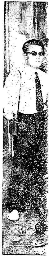
دق نمبر 2 دري فک هاري اين

سکالي بغسا ۲ اسيع، دان اخرن کيت دافتي سکل اف جوا فراوباهن يغير لا کوهان دسکيتر بندر دان کاوسن ۲ يغير همفيران دغئن سهاج منکل کاوان دکفموغ دان ديسا تيدق اد فراوباهن.