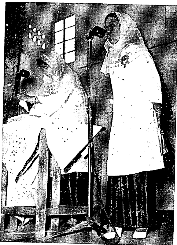
چيء عزيزه داود سدغ مميري كات ۲ سبوتن دالم احتفال مدرسه مشهور الاسلاميه للبنات فولو فينڭ .

كسينفوانن : بڭسا ملايو هيدوف دكمنوع ۲ دان دديسا ۲ سدغ فمرته هان مميري فرهاتين كفد فندودق ۲ بندر سهاج . اوله ايت اتتوق كجاجوان بڭسا ملايو دان اتتوق منيڭكيكن ايكونومي بڭسا ملايوم فمرته فرلو سكاله مميري فرهاتين كفد كمنوع دان ديسا سكل فرخدماتن مشاركة دان سكل اف كموداهن دان كسناغن يڭداداكن دبندر هندقله جوڪ داداكن دكمنوع دان ديسا .