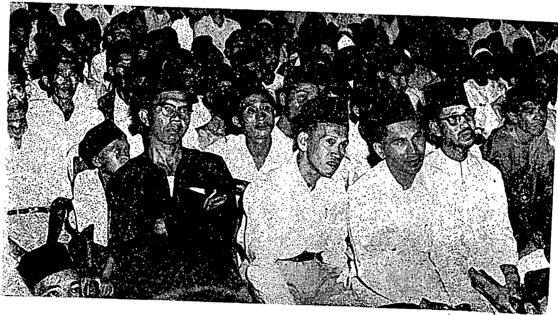
دغن فنوه سماغته اومه اسلام سیفاورام سدغ مندغر شراحن یغ برنس دری کیای حاج انوار مسدد. مجلس این تله دادکن دوائر جوجیاه بهارو ۲ این

زای نکری دان فیدرال مک ددالم فیلیهنرای بهدادکن بهارو ۲ این ددافتی اگق سوکر سدیکیه مسکیفون فرایکاتن ماسیه دافه بمولوه کباپکن کروسپی ۲. این اداله سوات دلیل بتاف قواتن الیران کبغسان ملایو دافه منجالر کروغکا هاتی اومه ملایو. دکلتنن دان دترغکانو سوده تربنتوق کراجان ملایو یایت کراجان فاس. کمناعن فاس ددالم مربوة تمفوق فمرتاهن نکری اداله سوات دلیل کماجوان فیکران رعیة ملایو دالم اوسها منتو دان میلیه اکن چارا هیدوف یغ مناسبه دغن جیوا ملایو. کماجوان برفیکر رعیة ۲ دفنډی تیمور دالم ماس دوا تیک تاهون این اداله ساتو ۲ نتیجه درفد تکانن اقتصاد کاتس رعیة ملایو سلورهن سرت ککاکن کراجان یشله لفس اتوق بموقتیکن حاصل ۲ جنجی یغذبواة سلوم فیلیهنرای یغدهولو.