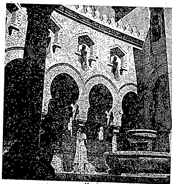
سوات فمنداغن دهلامن مسجد واشيقتن .

هلامن برالسكن باتو مرمر. دتغن ٢ برديري سبواه فنچارن اير. برسكي انم دان برتيغكة دوا. دهياسي دغن دوا بلس فاتوغ سيغا. دري مولة