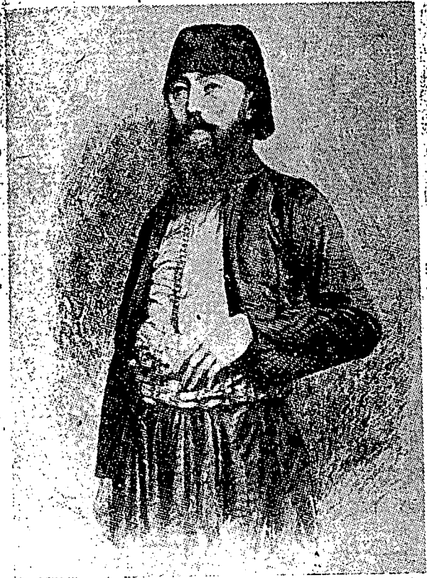
ادوارد فالمر (1840 - 1882)، فنسرح بهاس عرب ديونيبرسيټي کمٺريج.

کوليج اين بمبوکاکن فينتون باکي فلاجر ۲ بهاس عرب يٺغريديري درٺفد بريباکي ۲ بهسا دان فواٺ، يٺغريلاين ۲ دان لواس فول کهنڊق دان تنتون مريک، داتارا مريک: اهل ۲ فراوسهان جروترا ۲، دان اهل ۲ علم لافيسن بومي، يٺغ منڊاٺتي ديٺري مريک ترٺقسا - دسيٺکن فلاجران دان جواتن - براٺکه مٺمبارا دتيمور يٺغه. اوله ايت فٺتھوان بهاس عرب يٺغ مريک فلاجري، مٺبري فلواٺ کهد مريک اتوق منجالنکن توکس ۲ مريک دغٺن مودهٺن، بکيتو جوک حالن فکاوي ۲ فٺتديٺر دستغه ۲ دائره اٺريکا منڊاٺتي بهاس عرب منجادي فمبنتو مريک، دان کران ايت دوا اتو تيک اوٺرغ دزي اتارا مريک اکن مننتوه ددالم کوليج اين فد تيف ۲ تاهون، سلاين درٺفد ايت، فلاجر ۲ بهاس ترکي دان بهاس فرسي سرت لاءين ۲ بهاس، يٺغ دتوتريکن اوله فندودق نکري ۲، اسلام، اداله منڊغ بهوا ممفلاجري بهاس عرب اياه سوات فرکارا يٺغ ساغه ۲ مستٺق باکي مريک، سفاي مريک دافة مٺيکوتي دغٺن بتول اکن فلاجران ۲، مريک دالم بريباکي ۲ لافغن