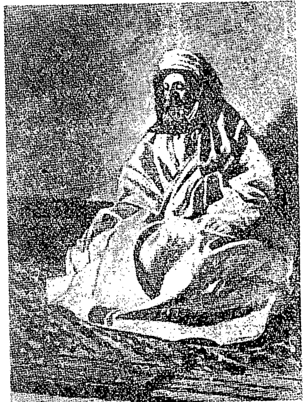
چارلس دوتی، ففارغ بوکو "فقمباران دفادغ صحراء سمنجوغ عرب". هیدوف داننارا تاهون ۱۸۴۳ دغن تاهون ۱۹۲۶. بوکون ایت تله دتربیتکنن دالم تاهون ۱۸۸۸. کمبرن یغ ترورا داتس دافه دلیهة فد کولیه بلاکغ بوکو ایت.

اهل ۲ فتهوان انگریس، تیدقله مریک معمیل برة ترهادف کبودایان اسلام کران سمات ۲ ای کبودایان اسلام، بهکن کران دنيا بارة تله