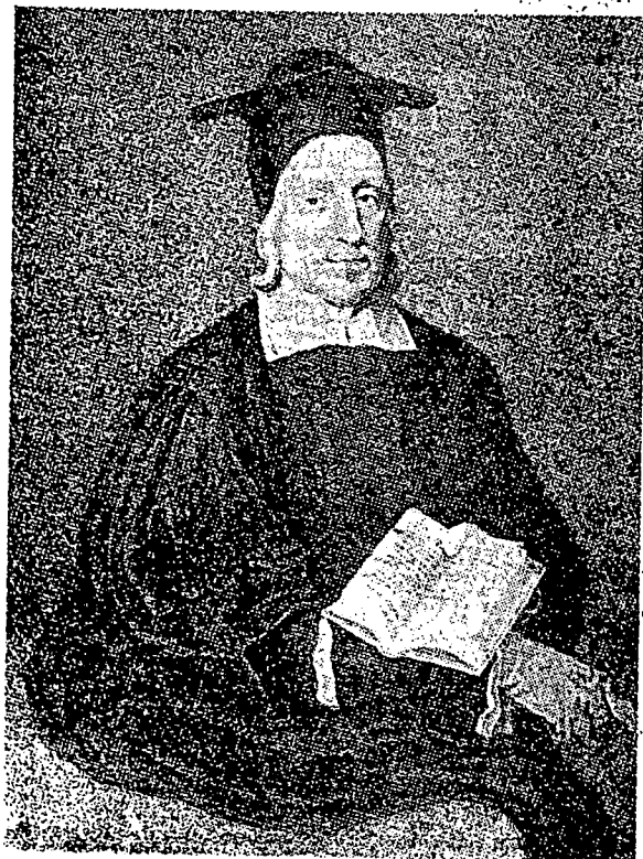
ادوارد بوکولم فنشسرح بهاس عرب دیونیرسیتی اوکسفوردم دالم تاهون 1797.

اد فون دلوار کاواسن اکادمی، مک اوسها میلیدیق دسمنجوع عرب، سبهاکین بسرث تله دلاکوکن اوله فعمبارا ۲، دري کریه بریتن. دالم قرون یغکسیلین بلس، بارتون، فیلکریب دان دوتی تله نمبارا دغن معمیل ماس یغ لام